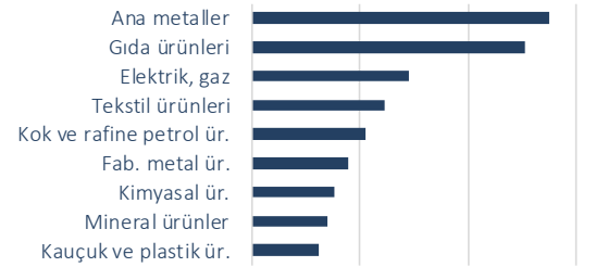
Harcama Gruplarının Yıllık Yİ-ÜFE Enflasyonuna Katkısı (baz puan)

Yıllık bazda bakıldığında ana metaller ile kok ve rafine petrol ürünleri sektörlerinde fiyat artışlarının sırasıyla %100,3 ve %92,2 ile yüksek düzeylerde gerçekleştiği görülüyor. Bu dönemde %45,52 düzeyindeki yıllık Yİ-ÜFE enflasyonuna en yüksek katkıyı 826 baz puanla ana metal ürünleri yaparken, gıda grubunun etkisi 757 baz puan düzeyinde gerçekleşti.