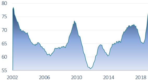
İhracatın İthalatı Karşılama Oranı (12 aylık kümülatif, %)

12 aylık kümülatif verilere göre ihracat 168,7 milyar USD ile tarihi yüksek seviyeye çıkarken, ithalat 217,2 milyar USD düzeyine geriledi. Böylece 12 aylık dış ticaret açığı da 48,5 milyar USD ile Mart 2010'dan bu yana en düşük seviyesine geriledi. İhracatın ithalatı karşılama oranı %77,7 ile 2002'den bu yana en yüksek düzeyine yükseldi.